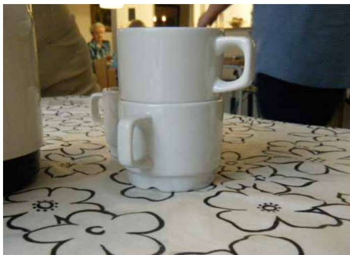
Det ligner måske en normal voksdug, men mønstret generer de demenste, der forsøger, at kradske skidt af.

At arbejde med livsglæden aktivt og at sige højt, at man gør det, er det der