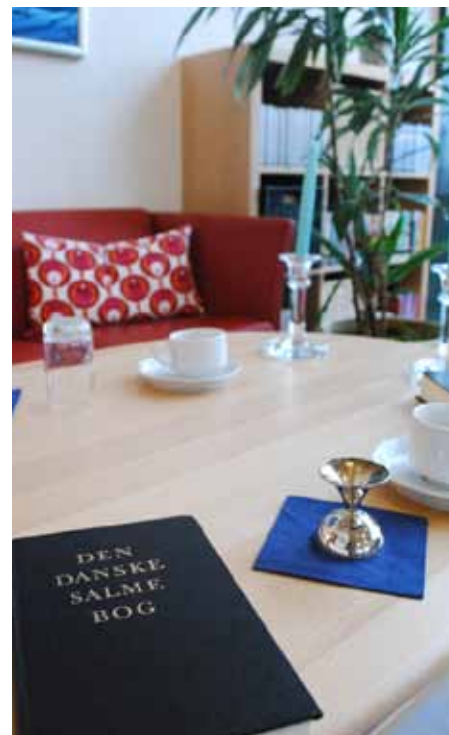
Gudstjenesterne på landets plejehjem er et gratis tilbud fra folkekirken. Plejehjemmene står selv for opdækning og planlægning.

der bliver gjort noget ud af gudstjenesterne. Mange af de ældre ser frem til dem, og det skaber en fælles platform for samtale på plejehjemmet resten af dagen.