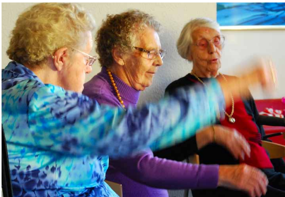
Sang og bevægelse er en af aktiviteterne, der skal gøre livet bedre for beboerne på Bronzealdervej.

I bund og grund er der ikke tale om nye idéer, men nærmere en opskrift på hvordan man kan starte fra bunden og få talt om, hvilken hverdag de ældre gerne vil have, så livskvaliteten er i højsædet. Og skal tilgangen til ældreplejen ændres, skal selv de mindste detaljer vendes på hovedet.