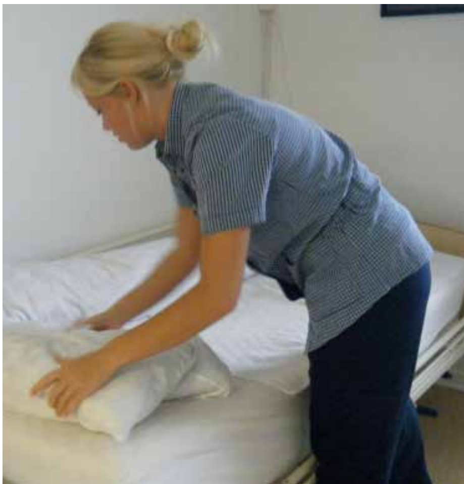
Arbejdet på Bronzealdervej er delt i tre. Første del er den basale personlige pleje, som bare skal være i orden. Anden del handler om livsglæde, og tredje del er det administrative arbejde.

ord på personalets arbejde, og det bevidstgør alle der er i berøring med plejehjemmet om, hvilke målsætninger plejehjemmet har i forhold til beboerne. Det har altid ligget på de tre kvinders rygrad at forbedre beboernes livssituation i det daglige arbejde.