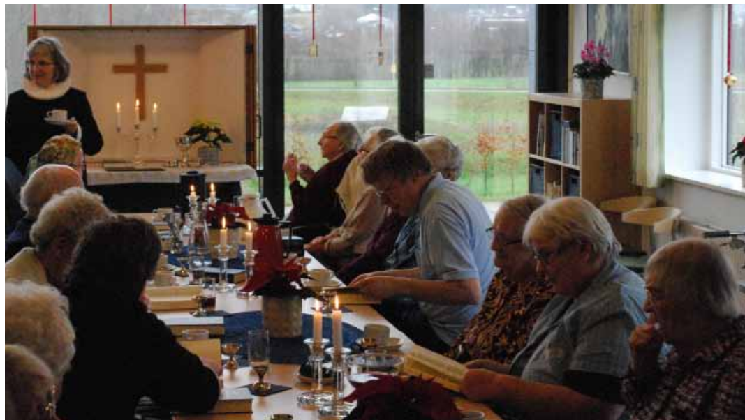
Tolv beboere, tre medarbejdere, et familiemedlem og fire frivillige medhjælpere er samlet om bordet til gudstjeneste i fællesrummet.

"Jeg bliver helt rørt, når jeg kommer her ud på Bronzealdervej, og ser, at bordet er dækket fint op, at alteret er sat op og klaveret er sat frem. Så bliver jeg virkelig rørt og også lidt ydmyg," siger hun.