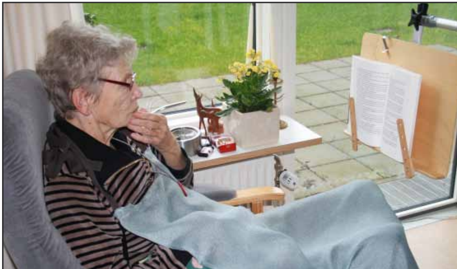
Fru Flinch elsker en god krimi. Det giver hverdagen et løft.

mehallen få hundrede meter fra plejehjemmet. Faktisk er Helga, trods sin fysiske tilstand, med i alle aktiviteter, der foregår på Bronzealdervej. Men ifølge hende selv, sker der slet ikke nok.