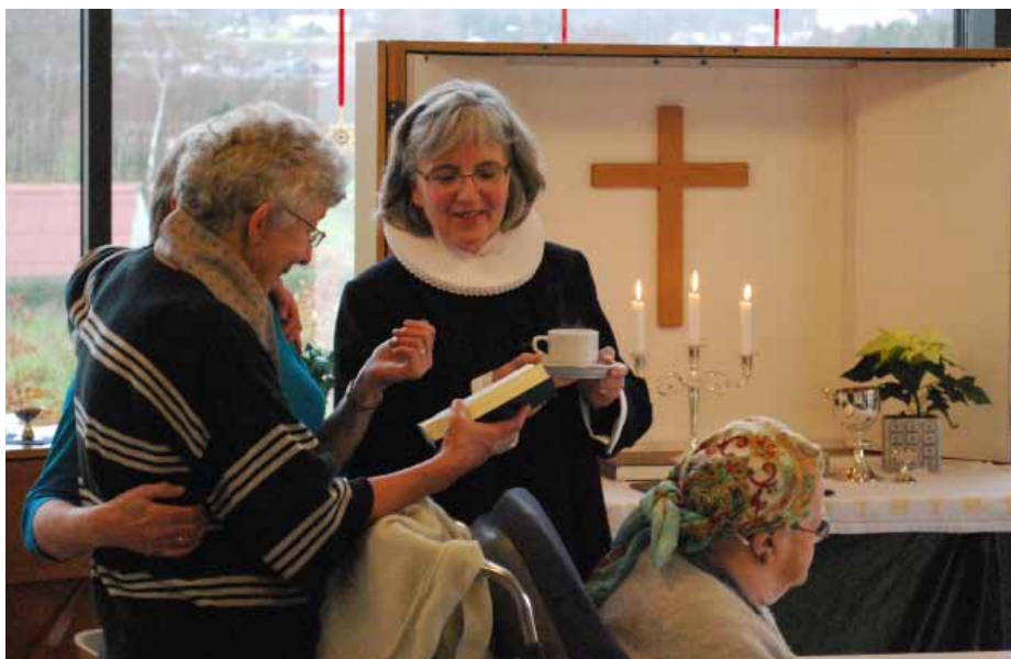
Efter gudstjenesterne er der altid tid til en kop kaffe og en snak.

En halv time før gudstjenesten kommer den første beboer. Hun har taget