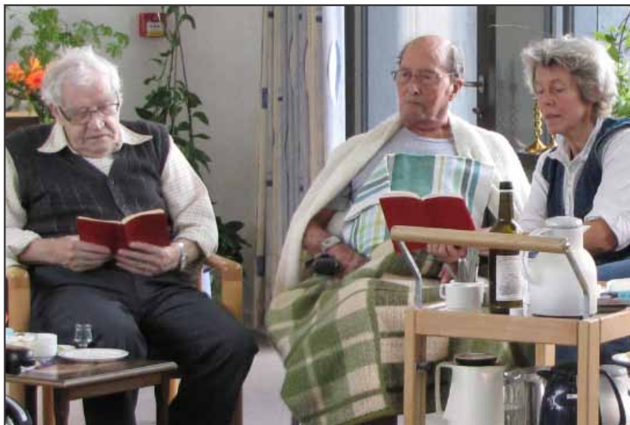
Hjemlig hygge, aktiviteter, nærhed med personalet og en god snaps er altså vigtige elementer på et plejehjem, hvor beboerne skal trives.